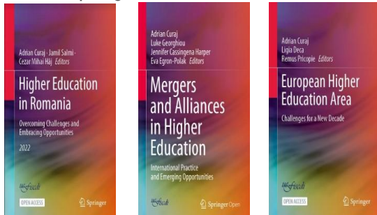
Universitatea Politehnică din București, 29 martie 2023